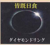
会社の職員玄関先にて、撮影しました。露出開放時間 50 秒くらいで、なんとか思い通りに撮ることができました。(汗)